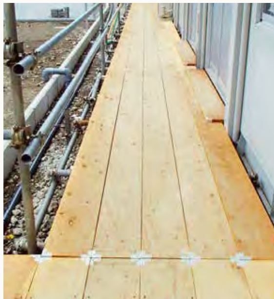
国産材足場板 使用事例