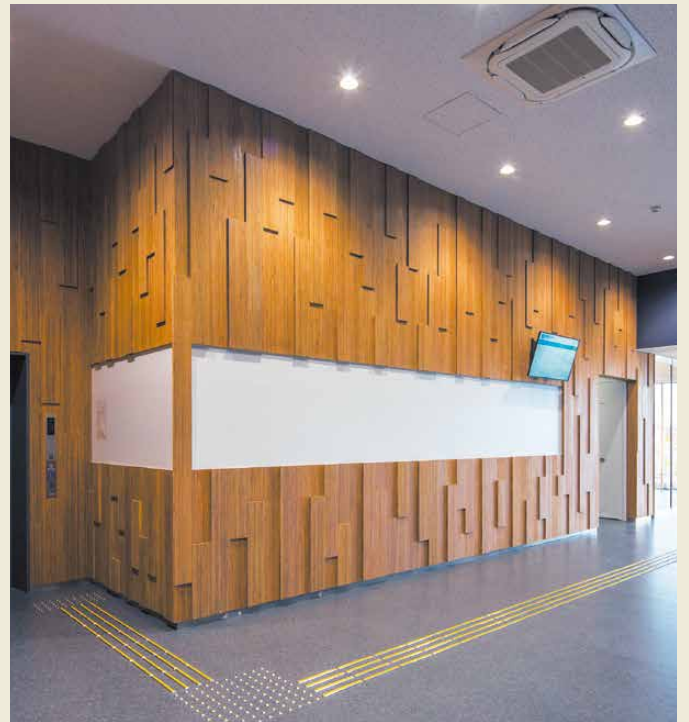
写真上：東京都公文書館 写真左下：山武市蓮沼交流センター 写真右下：木更津市消防本部庁舎